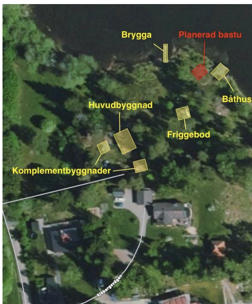
Översiktlig karta över fastigheterna och den planerade byggnationen (gul markering visar befintlig bebyggelse)