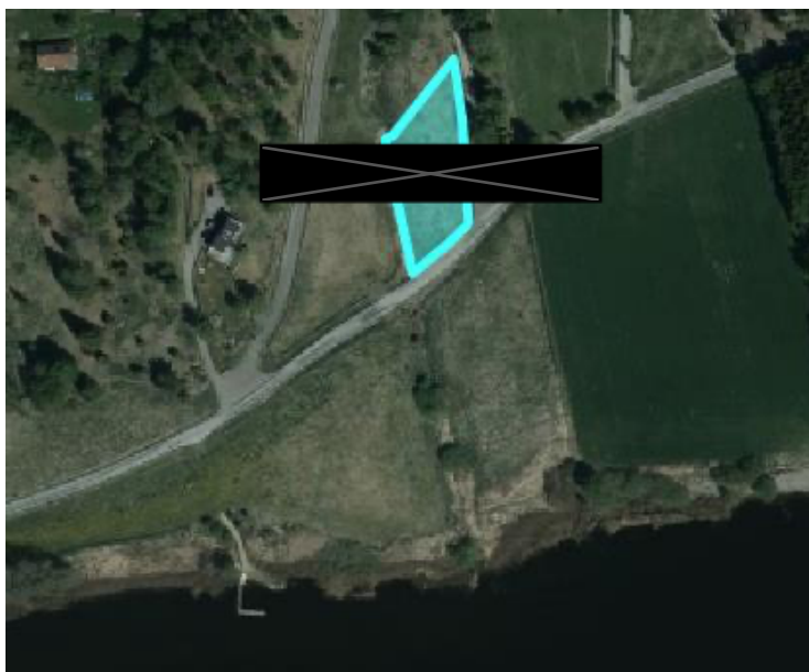
Figur 1: Ola Hjelm's fastighet, länsväg 971 och strandlinjen