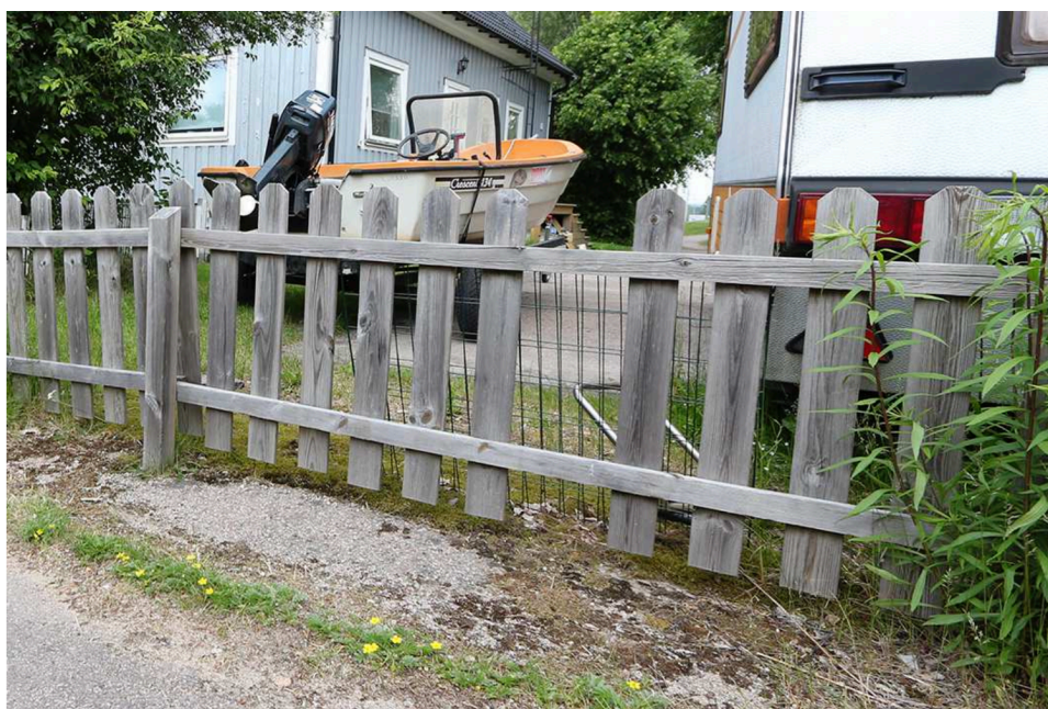
Figur 17. Hålet i staketet där det från grannsidan lutats kompostgaller mot staketet.