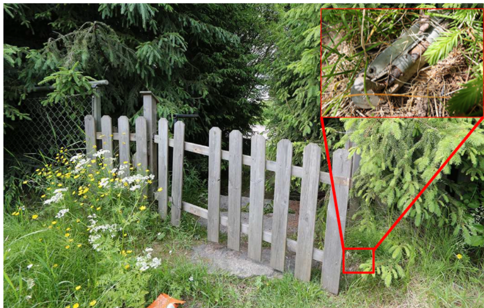
Figur 11. Grinden i det nordöstra hörnet. Grinden saknar låsanordning och i gräset invid grinden låg en skjutregel. En bräda saknas i grinden. Infälld bild i övre högra hörnet visar skjutregeln när den vänts på efter fynd.