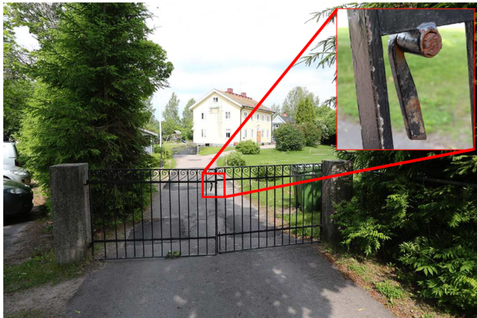
Figur 7. Södra grinden. En järngrind där grindklinkan var av på insidan och brottytan på klinkan var rostangripen. Grinden öppnades inåt utan kraftanstängning. Infälld bild i övre högra hörnet visar den trasiga klinkan.

4.8.2 Av brottsplatsundersökningen framgår bland annat att de grindar som fanns på fastighetens södra och nordöstra delar var trasiga och kunde öppnas med lätthet (se protokoll över brottsplatsundersökning den 28 juni 2021, bilaga 14 , s. 5, 7 och 10 f., varifrån bilder och bildtexter i avsnitt 4.8.2 och 4.8.3 nedan har hämtats):