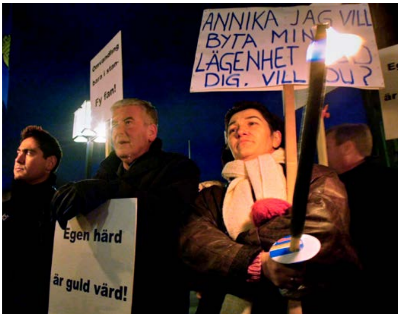
Östbergaborna demonstrerar för sin ombildningsrätt utanför Stadshuset i Stockholm den 16 december 2002.